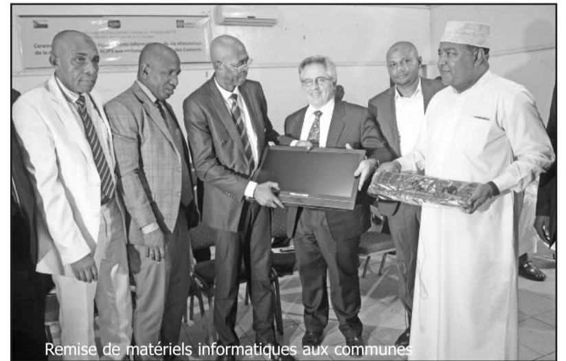
Remise de matériels informatiques aux communes

Le président de l'association des maires de Ngazidja a quant à lui