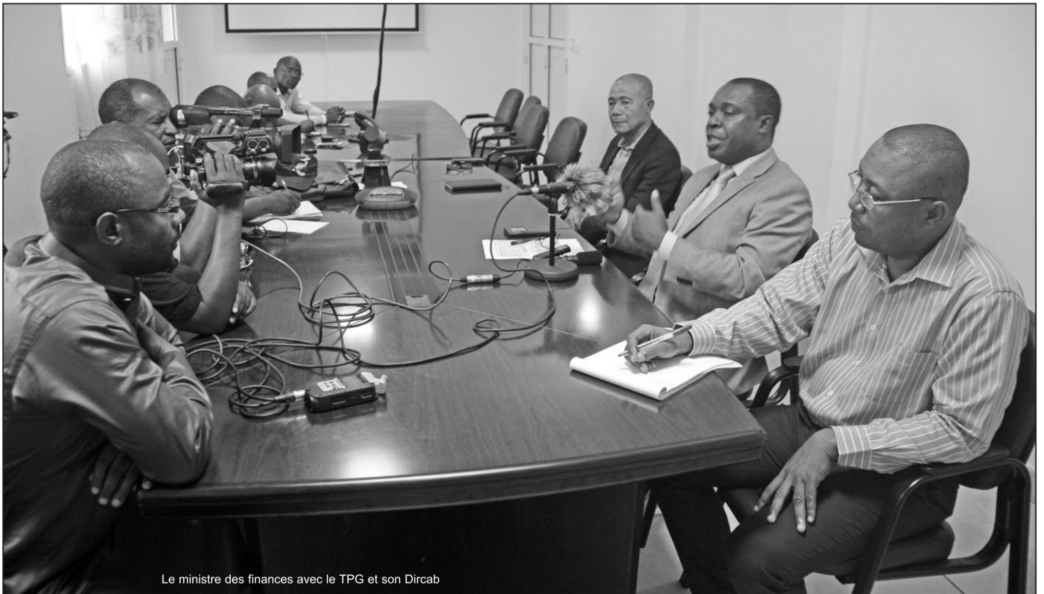
Le ministre des finances avec le TPG et son Dircab