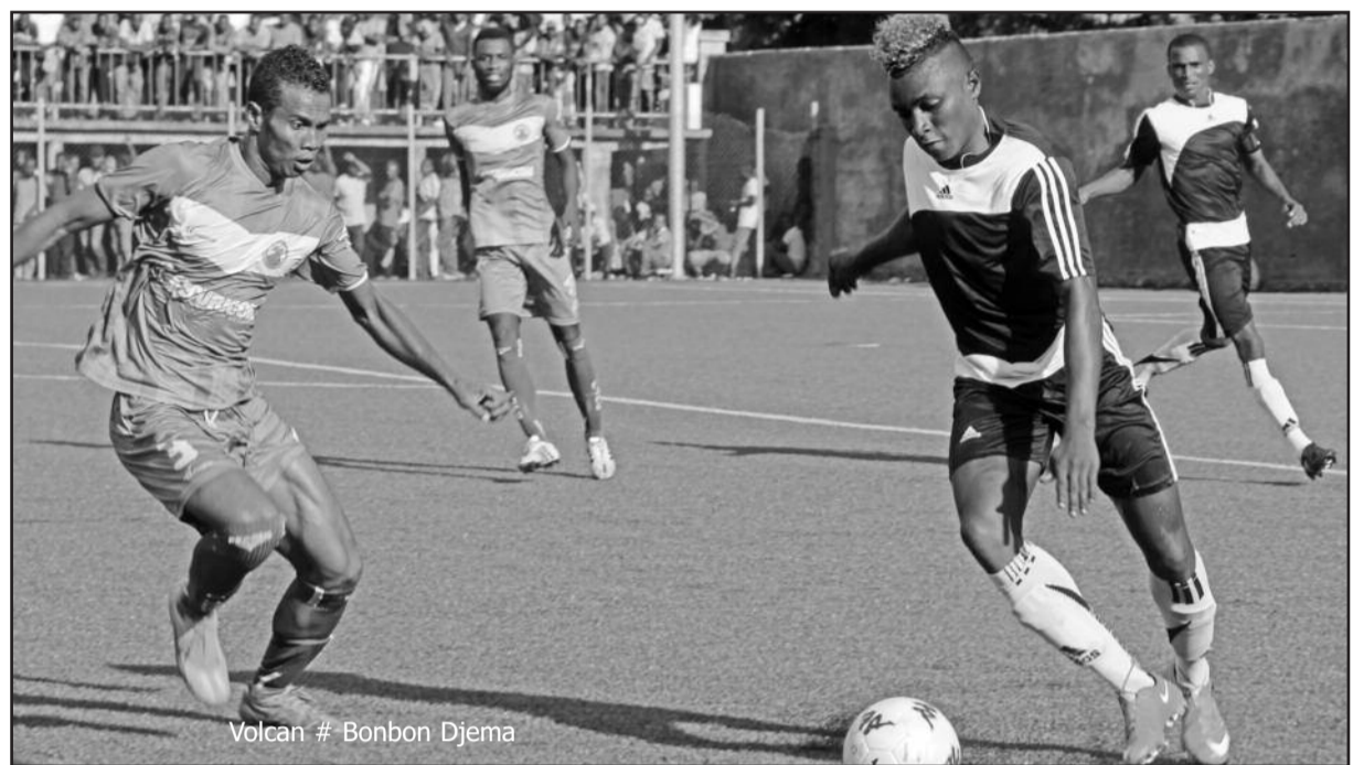
Volcan # Bonbon Djema

C/ Observation. Deux procès-verbaux auraient été publiés officiellement par la Commission d'Homologation et de Discipline de la Ligue de Ngazidja. Certaines équipes auraient vu leur statistique amputé des points, en faveur d'autres. Donc, ce classement provisoire a été établi indépendamment des verdicts, prononcés par ces procès-verbaux. Le classement définitif sera communiqué plus tard. Il pourrait être sans appel.